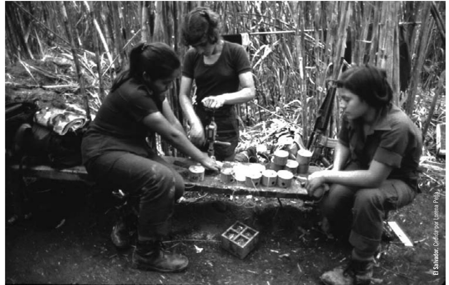
El Salvador. Cedita por Lorena Peña

Una guerra no es un camino de rosas. Una guerra es un recurso último y brutal al que no debemos aspirar como camino de progreso en todo momento. El ideal de democracia, de igualdad, de justicia, y de paz debe guiarnos siempre, y la mejor forma de no retornar al pasado es recordando correctamente lo vivido y luchando por superar definitivamente la violencia institucionalizada en la pobreza, en la exclu-