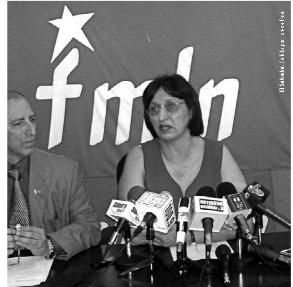
El Salvador.

La maternidad. La mayoría de mujeres que tuvimos hijos e hijas durante la guerra tuvimos que salir a parir y después dejarles con familiares, en refugios o en las comunidades cercanas para luego regresar de nuevo al frente de guerra. Este hecho para nosotras era un acto de conciencia, creo que la mayoría —hasta hoy— no renegamos de haberlo hecho y haber decidido en aquel momento volver a reincorporarnos a la guerrilla. Sin embargo, era generalizado que después de sufrir ese dolorosísimo proceso de separación de nuestros hijos e hijas, regresábamos a un medio donde a nadie le interesaba saber de estos dolores, donde habitualmente se nos relegaba a tareas inferiores a las que teníamos antes y, donde por lo general, encontrábamos al padre de la criatura nuevamente acompañado... y esa soledad profunda, y esa depresión terrible, si no era superada con rapidez, era tomada como muestra de una debilidad personal. Porque, al igual que en estos tiempos, el sistema celebra la maternidad y al mismo tiempo condena a las madres con mil hechos sutiles o brutales. Y qué formidable conciencia teníamos y tenemos las mujeres, que nos sobreponíamos a todo esto para seguir luchando por el ideal en que creíamos y creemos fir-