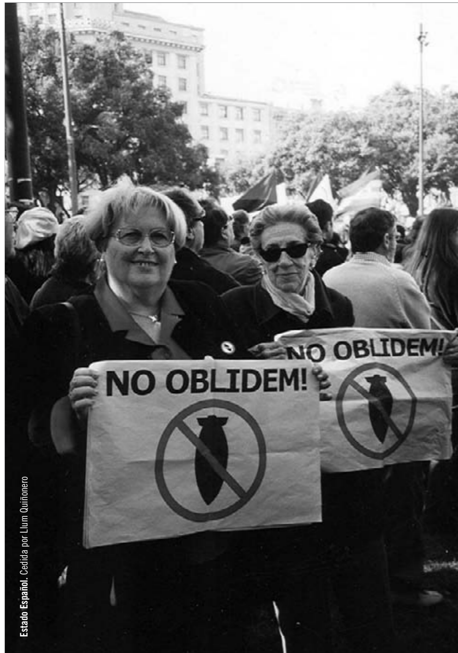
Estado Español.