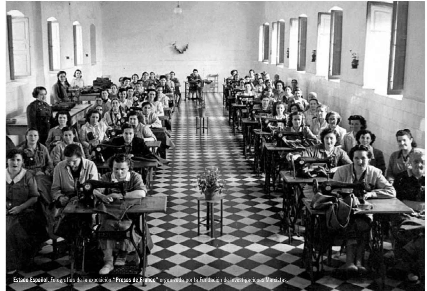
Estado Español. Fotografías de la exposición “Presas de Franco” organizada por la Fundación de Investigaciones Marxistas.

El primer gran debate cuando se trata la cuestión de la represión femenina durante la Guerra Civil española y la primera posguerra suele producirse al tratar de señalar el número exacto de mujeres encarceladas durante ese periodo. Nos encontramos, antes que nada, con un problema de falta de fuentes. El silencio que las autoridades franquistas mantuvieron respecto a las prisioneras impide, o al menos dificulta mucho, la tarea de cuantificar el fenómeno. No hay datos oficiales y los pocos que hay no parecen fiables. Parece ya descartada la cifra de 17.800 encarceladas que José Manuel Sabin propuso para 1940. Este número queda invalidado por el hecho de ser una mera extrapolación a partir del porcentaje de mujeres de la prisión de Toledo y basándose en datos