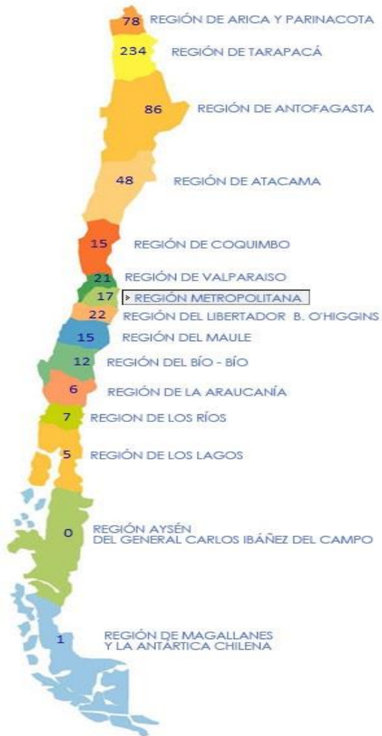
Diagrama 1: Mapa de Chile regionalizado por tasas de mujeres encarceladas (100.000 habitantes)

frente a la tasa de mujeres encarceladas. Así, sí en el año 2010 ocupaba el quinto lugar (bajo las cuatro regiones del norte grande del país), para el año 2014 ocupaba el lugar número siete, bajo las regiones del norte grande y las del Libertador Bernardo O'Higgins y de Valparaíso.